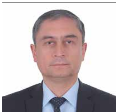
Л. Н. ТУЙЧИЕВ, Ўзбекистон Республикаси Соғлиқни сақлаш вазирининг ўринбосари

«Ўзбекистонда оналар ва болалар саломатлигини муҳофаза қилиш хизматларини такомиллаштириш» — деб номланган ҳамкорлик лойиҳаси Европа Иттифоқи, Соғлиқни сақлаш Вазирлиги, ЮНИСЕФ ва ЖССТ ўртасида самарали ва муваффақиятли ўзаро ҳамкорликнинг ёрқин мисоли сифатида хизмат қилади. Лойиҳанинг биринчи ва иккинчи босқичларининг муваффақиятли натижалари мустақилликнинг илк кунларидан бошлаб Ўзбекистонда соғлом ва баркамол авлодни вояга етказиш каби устувор йўналиш сари дадил олға интилиш давлат сиёсатининг юқори самарадорлигини яна бир бор тасдиқлади. Ҳамкорликда амалга оширилган чоралар оналик ва болаликни муҳофаза қилиш тизимини янада ривожлантириш ва кучайтиришга қаратилган чора-тадбирларни амалга оширишни давом эттиришга имкон яратади ва шу билан бирга, давлат, хамжамият ва халқаро ташкилотлар орасидаги ҳамкорликни мувофиқлаштиришни таъминлаш ва мамлакатимиздаги барча болалар соғлом туғилиб, ўсишлари учун керакли шароитлар яратилишини кафолатлайди.