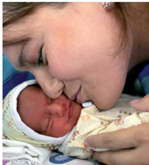
Она ўзининг янги туғилган чақалоғи билан.

Лойиҳа ёрдамида Соғлиқни сақлаш Вазирлиги Тиббий Хизмат Сифатини Яхшилашга йўналтирилган икки турдаги миллий ресурс-марказини очди ва ушбу марказ, оналар ва болаларнинг соғлигини мустаҳкамлаш соҳасида фаолият юритаётган мутахассисларга тиббий хизмат сифатни яхшилаш воситаларини ўз муассасаларида қўллаш ва лойиҳа тадбирларининг барқарорлигини таъминлашда катта ёрдам беради. Ушбу Марказлар Республика ихтисослашган Педиатрия илмий-амалий тиббиёт маркази ва Республика перинатал Марказида жойлашган.