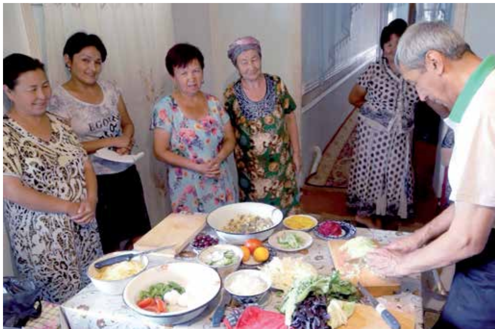
Қорақалпоғистон Республикаси Чимбой туманидаги ошпаз маҳорат дарсларини ўтказмоқда.

Оилаларга бириктирилган ҳамширалар ва жамоат маслаҳатчилари томонидан ташкиллаштирилган БМА жараёни ҳамжамият гуруҳларига 5 та амалий ҳаракатларга ўз муносабатларини баҳолаш ва уларни ўзгартириш йўлидаги тўсиқларни енгиб ўтишда муҳим аҳамият касб этади.