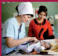
Шифокорлар 11 561