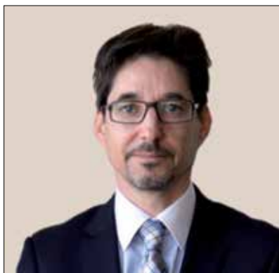
Ю. ШТЕРК, элчи, Европа Иттифоқининг Ўзбекистондаги Делегацияси раҳбари

«Ўзбекистонда оналар ва болалар саломатлигини муҳофаза қилиш хизматларини такомиллаштириш» — деб номланган ҳамкорлик лойиҳаси Европа Иттифоқи, Соғлиқни сақлаш Вазирлиги, ЮНИСЕФ ва ЖССТ ўртасида самарали ва муваффақиятли ўзаро ҳамкорликнинг ёрқин мисоли сифатида хизмат қилади. Лойиҳанинг биринчи ва иккинчи босқичларининг муваффақиятли натижалари мустақилликнинг илк кунларидан бошлаб Ўзбекистонда соғлом ва баркамол авлодни вояга етказиш каби устувор йўналиш сари дадил олға интилиш давлат сиёсатининг юқори самарадорлигини яна бир бор тасдиқлади. Ҳамкорликда амалга оширилган чоралар оналик ва болаликни муҳофаза қилиш тизимини янада ривожлантириш ва кучайтиришга қаратилган чора-тадбирларни амалга оширишни давом эттиришга имкон яратади ва шу билан бирга, давлат, хамжамият ва халқаро ташкилотлар орасидаги ҳамкорликни мувофиқлаштиришни таъминлаш ва мамлакатимиздаги барча болалар соғлом туғилиб, ўсишлари учун керакли шароитлар яратилишини кафолатлайди.